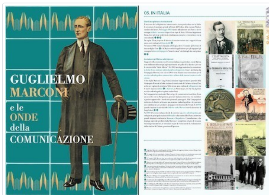
Due dei venti pannelli in cui si articola il percorso dedicato allo scienziato

L'allestimento ha debuttato proprio a Sasso Marconi, nel contesto della manifestazione voluta dall'Unione stampa filatelica italiana dal 6 all'8 settembre. Tra gli altri appuntamenti previsti, non gli unici, quelli di Prato (è programmato dal 25 ottobre al 21 novembre presso la biblioteca "Alessandro Lazzerini" di via Puccetti 3, con la conferenza degli autori alle ore 15 di venerdì 15 novembre), di nuovo Sasso Marconi (dal 26 ottobre al 3 novembre per la "Tartufesta"), Camerata Cornello, Roma.