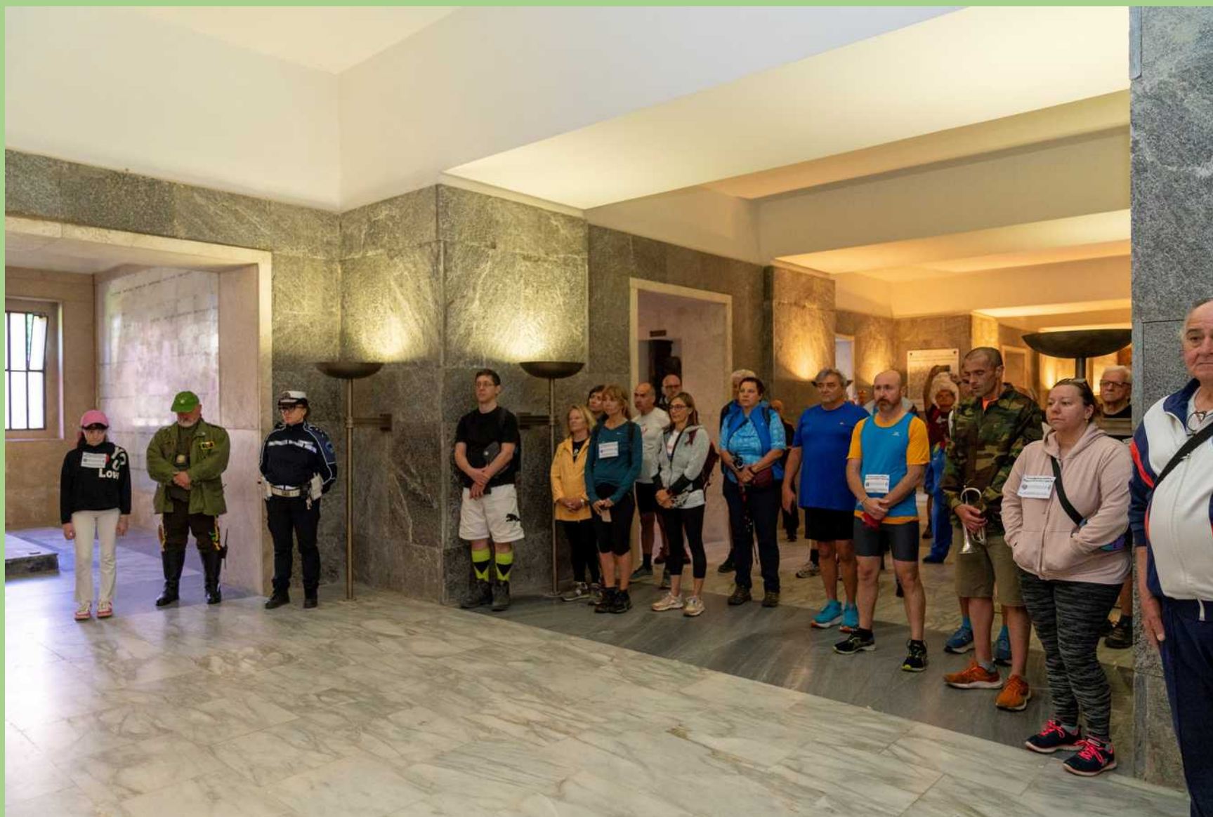
Omaggio ai caduti da parte dei podisti