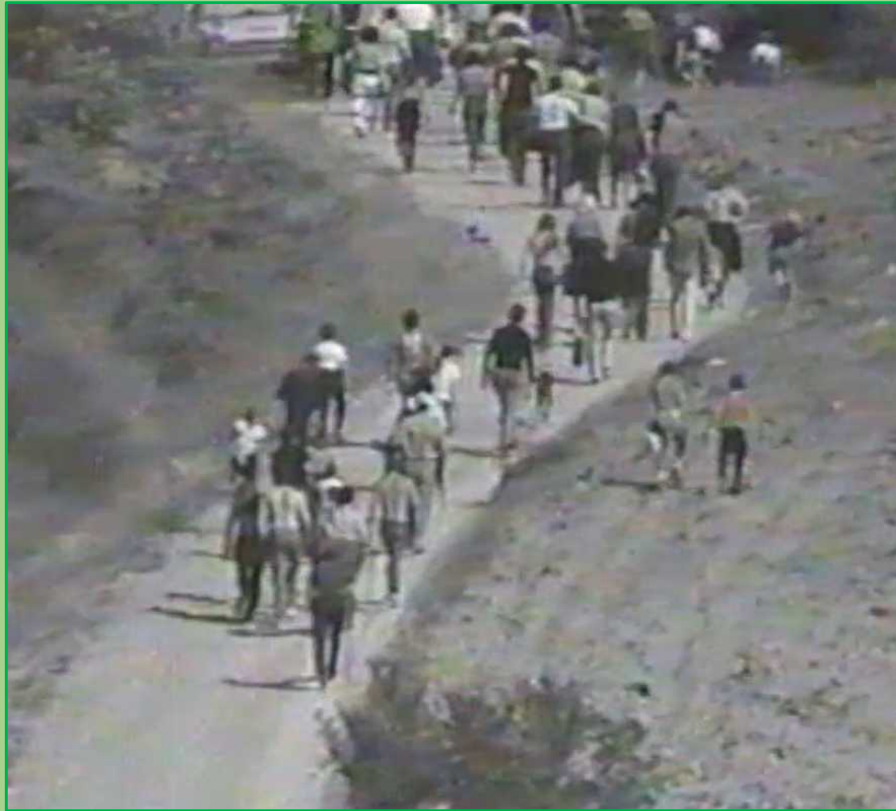
Prima edizione della Camminata del Postino - 1974