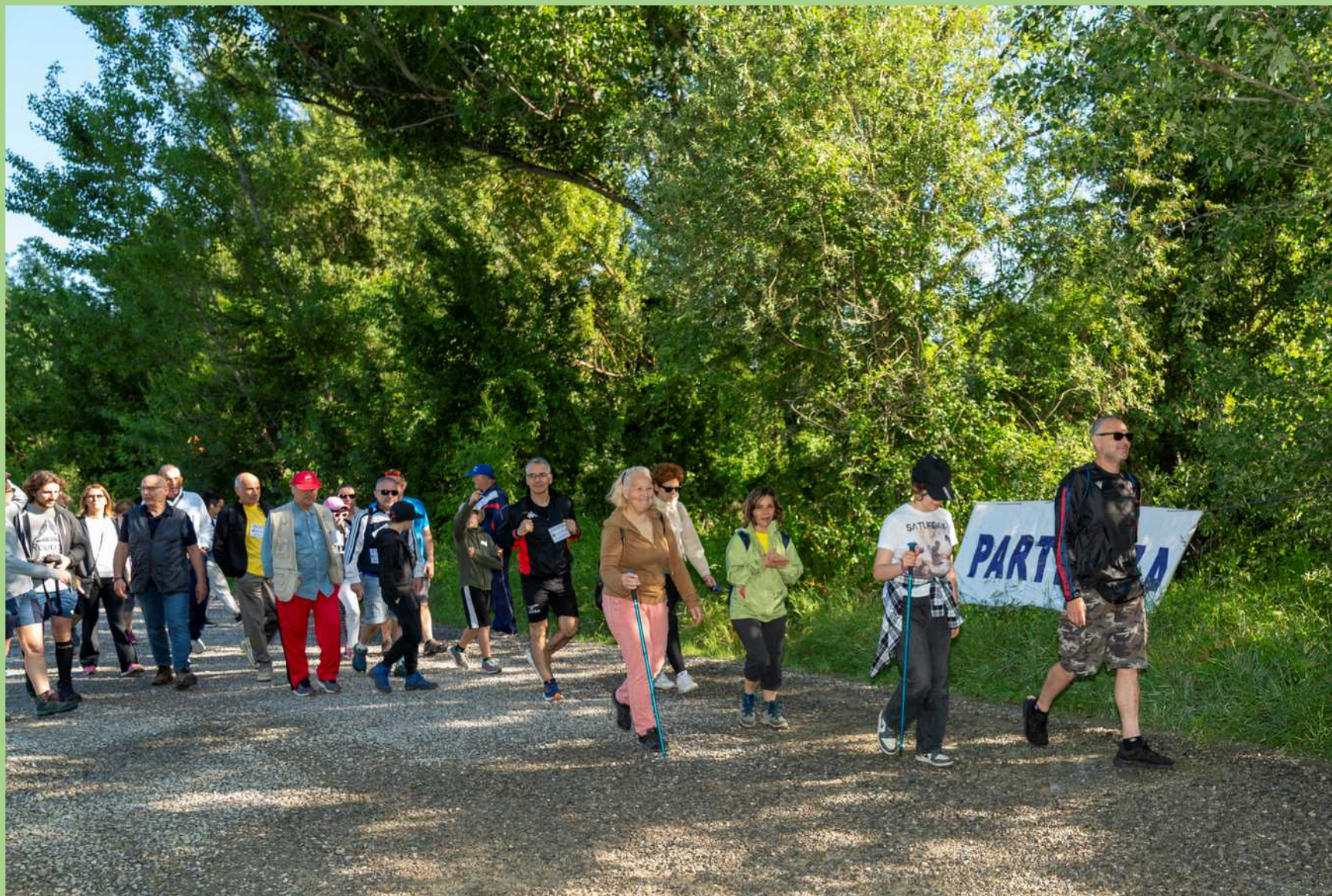
Partenza della Camminata dal Parco Bottonelli di Marzabotto