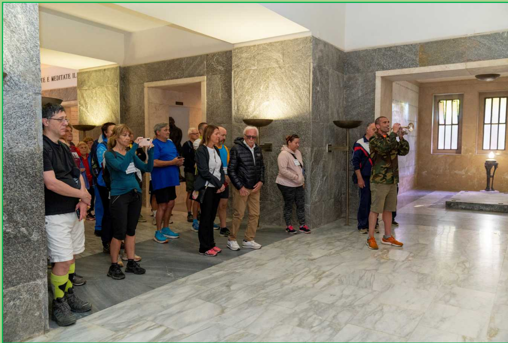
Omaggio ai caduti con la melodia de Il Silenzio