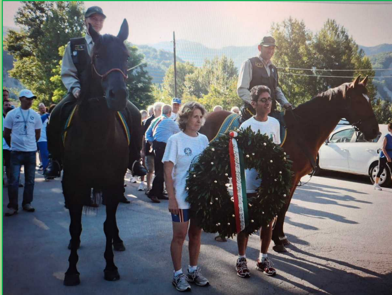
La deposizione della Corona nell'edizione del 2011