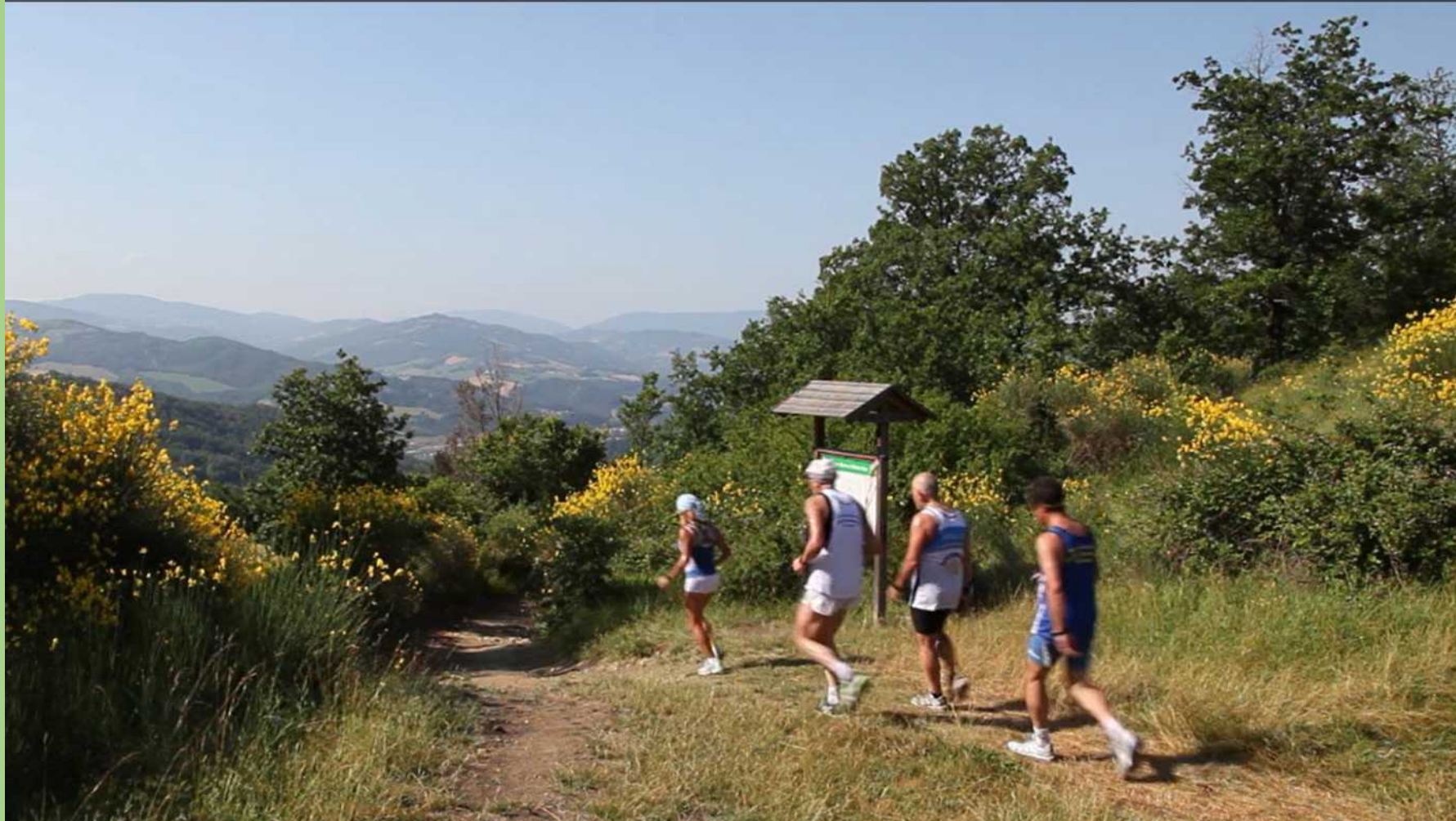
Passaggio alla Sella di Caprara - Monte Sole