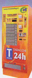
Stella 72 x 62 x 186 cm