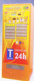
Superluna 72 x 60 x 186 cm