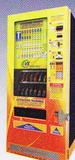
Saturno 87 x 91 x 194 cm