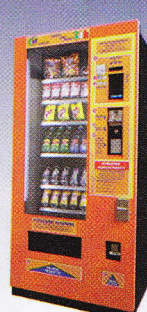
Snack 36 83 x 85 x 185 cm