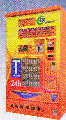
Venere 75 x 41 x 128 cm