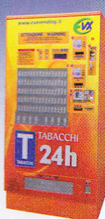
Giove 90 x 62 x 186 cm