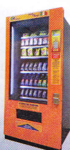
Snack 48 83 x 85 x 185 cm

Collegabili a qualsiasi Distributore EYX